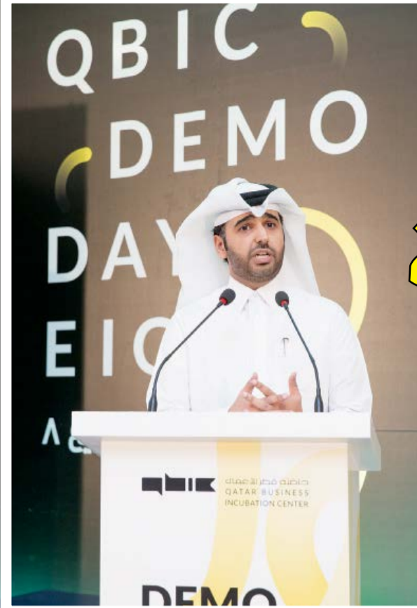
عبد العزيز آل خليفة