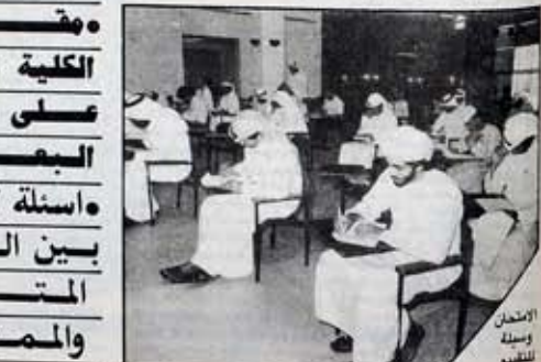
الامتحان وسيلة للتقييم