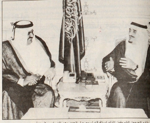
خادم الحرمين الشريفين أثناء استقباله لسمو ولي العهد بعد ظهر امس في جدة

سمو ولي العهد يستعرض مع العاهل السعودي مسيرة مجلس التعاون والقضايا الدولية والعربية والاسلامية