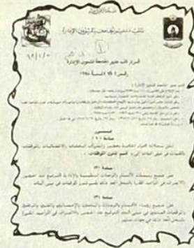
صورة من القرار

قد نصت المادة الاولى من القرار الثاني على نقل سجلات الدوام الخاصة بحضور وانصراف الباحثات والاحصائيات والموظفات والفنيات في مبنى البنات الى قسم شؤون الموظفين، فيما اكدت المادة الثانية على جميع رئيسات الاقسام والوحدات التنظيمية والادارية التوقيع عند الحضور والانصراف في المواعيد المقررة بالسجل المعد لذلك بقسم شؤون الموظفين في مبنى البنات، وجاءت المادة الثالثة من القرار لتؤكد على جميع رؤساء الاقسام والوحدات والباحثين والاحصائيات والفنيين والموظفات العاملين في مبنى البنات التوقيع عند الحضور