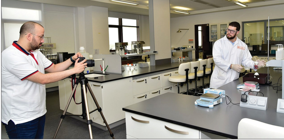
خلال تسجيل محاضرة في المختبر

تستمر عملية التعليم عن بعد في جامعة قطر بكفاءة ونجاح في ظل التحول الرقمي الذي شهدته منذ اعلان تعليق الدراسة لدعم الجهود المبذولة في مكافحة فيروس كورونا هذا ما اكده عدد من عمداء الكليات ل. الشريك. وأشاروا الى ان هناك آلية جديدة لتقييم الطلبة سيتم اعتمادها وتطبيقها في جميع الكليات. وقالوا ان جامعة قطر قامت بتشكيل لجنة مكونة من عدة أعضاء لوضع آلية جديدة لتقييم الطلبة وستقدم هذه اللجنة مقترحاتها الى كافة الكليات حول كيفية احتساب الدرجات والية التقييم وكيفية أداء الاختبارات وذلك في حال طال تعليق الدراسة الجامعية. كما ستقوم اللجنة برسم خطة متكاملة لتقييم أداء الطلبة وستقدم الحلول المقترحة وستعد آلية جديدة للتقييم وتقدم البدائل المقترحة وتقدم حلولاً لكيفية أداء الامتحانات والاختبارات.