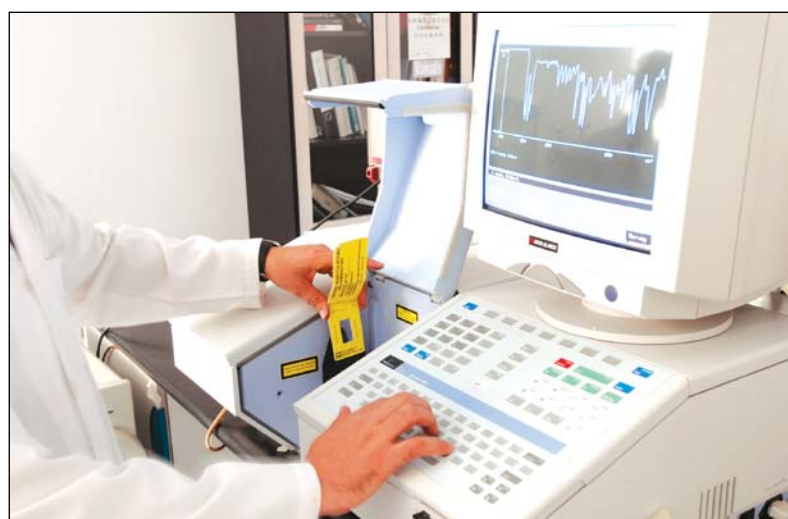
تطبيق التكنولوجيا الحديثة

وتضمنت المنح الهندسة والتكنولوجيا و39 العلوم الزراعية والعلوم الإنسانية و2 العلوم الطبية والدوائية و2 العلوم الطبيعية و13 العلوم الاجتماعية 7 ليكون المجموع 64.