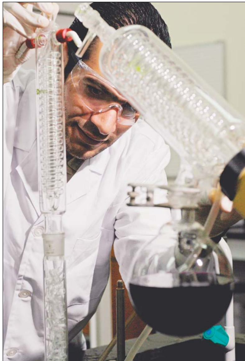
المعامل البحثية في الجامعة